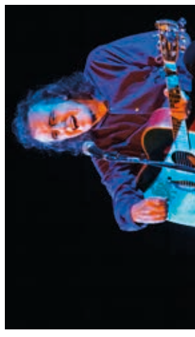
Über 600 begeisterte Zuschauer erlebten Weltstar Donovan live im Leo Theater.