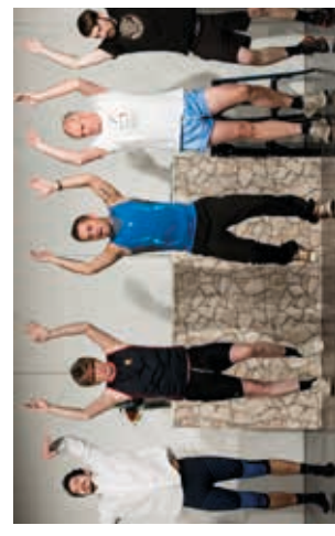
Fitness-Programm der besonderen Art gibt es im „Männerparadies“ zu bestaunen.