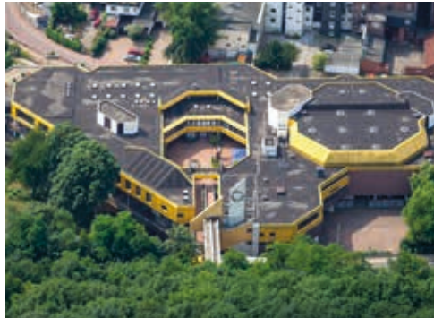
Eine ungewöhnliche Perspektive vom Haus Ennepetal

etwa eine Stunde vor Beginn der Veranstaltungen. Hier erhalten Sie Kalt- und Heißgetränke. Nach den Vorstellungen besteht hier die Möglichkeit, mit den Schauspielerinnen und Schauspielern ins Gespräch zu kommen. Ein Treff für alle Theaterfreunde.