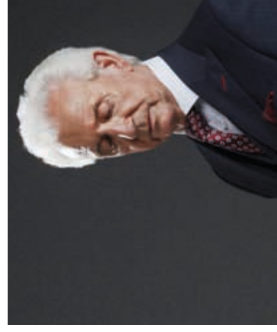
Weltstar Tony Christie kommt am 4. Dezember ins Leo Theater. Sichern Sie sich jetzt Ihre Tickets! Eintrittspreise von 33 bis 59 Euro.

Informationen über aktuelle Spielplan-Änderungen unter www.leo-theater.ruhr